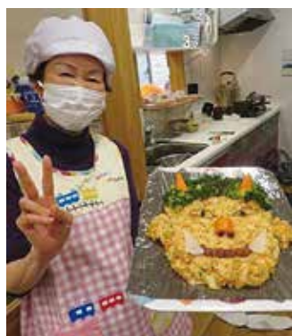
節分の行事食(オニのピラフ)

発達に応じたおもちゃ、遊びを通して子どもと職員との信頼関係を築き、安心して過ごせるようにしています。また、常に職員間で十分に話し合い、最善の保育が出来るようにしています。保護者の皆さんには、丁寧に保育の内容や様子を伝え、「麦の子に預けて良かった」と感じて貰い、子どもの成長を共に喜び合い、何でも気軽に相談出来るような信頼関係を築くことを大切にしています。 子育ての悩みに寄り添い、一緒に遊ぶ機会をつくることで、「困った時には麦の子に!」「この地域に麦の子があつて良かった」と思ってもらえるよう、園の開放や育児相談をしています。