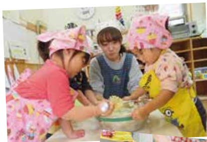
(写真上)今日はクッキー作り。たくさん食べます! (写真右)大きなお芋が掘れたよ